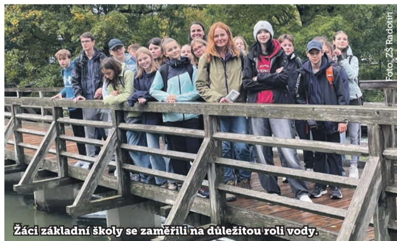
Žáci základní školy se zaměřili na důležitou roli vody.

oni na podzim se vybrané žákyně a žáci Základní školy Praha-Radotín vydali do Slovinska, aby ve městě Škofja Loka pracovali společně se svými vrstevníky na projektu Kapka vody. Ten se zaměřuje na environmentální výchovu a uvědomění si důležitosti vody pro život na Zemi. Akce byla součástí programu Erasmus+.