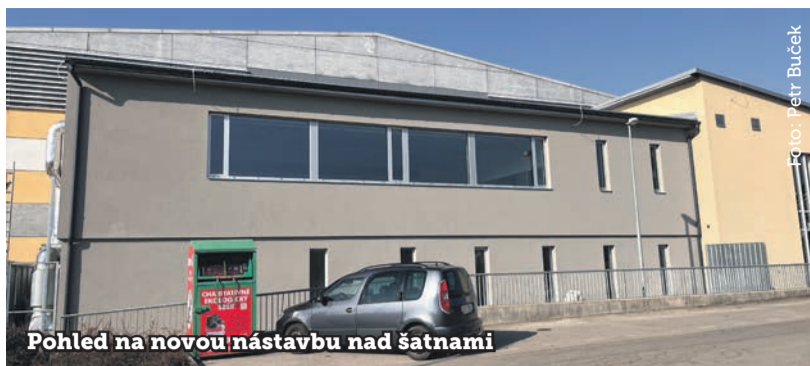
Pohled na novou nástavbu nad šatnami