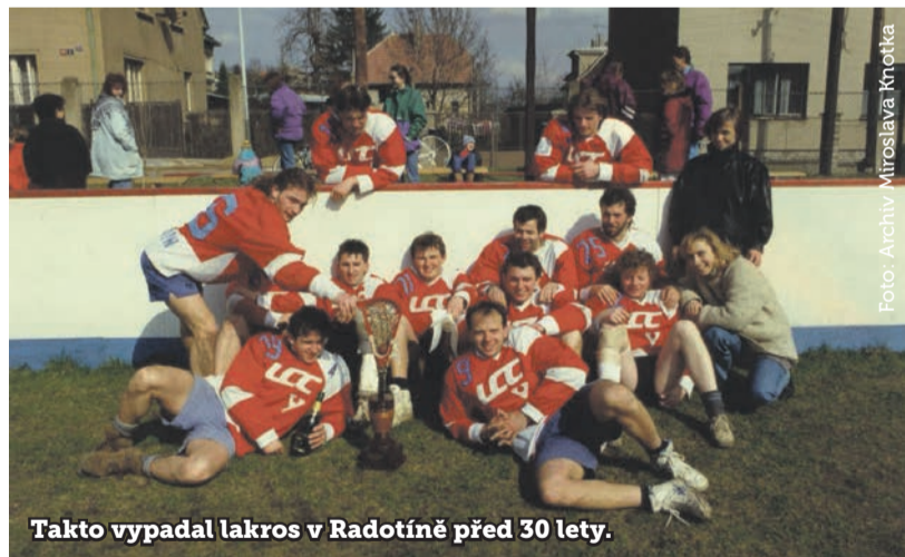
Takto vypadal lakros v Radotíně před 30 lety.