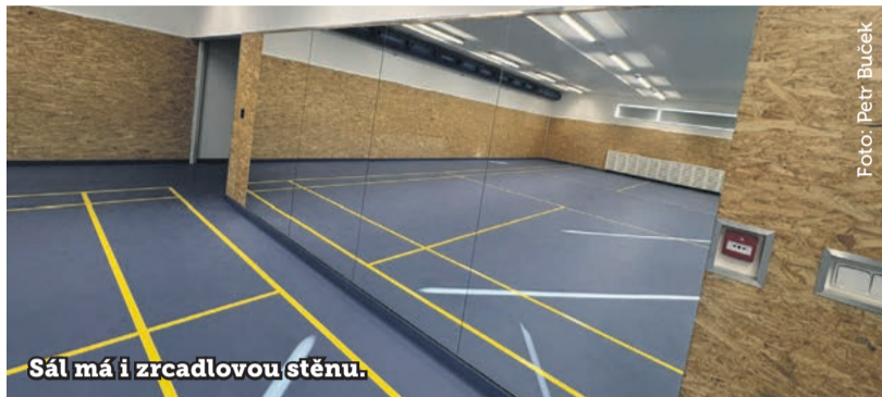
Sál má i zrcadlovou stěnu.