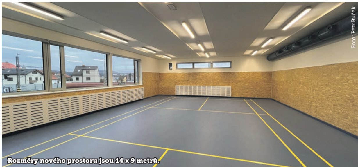
Rozměry nového prostoru jsou 14 x 9 metrů.