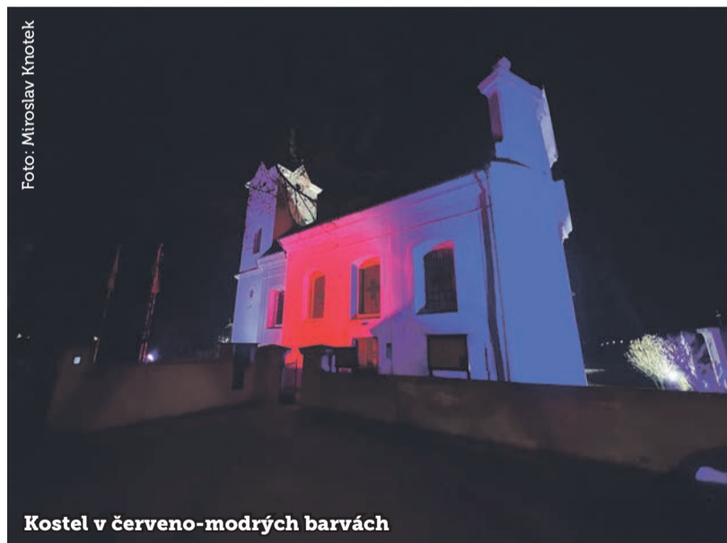
Kostel v červeno-modrých barvách

K ostel sv. Petra a Pavla v Radotíně dostal moderní LED osvětlení a ve slavnostní dny je nyní možné kostel nasvítit tematickými barvami.