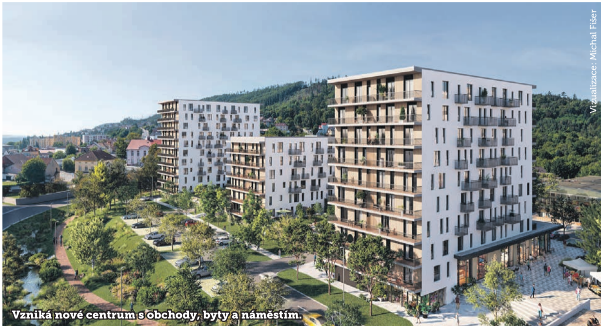
Vzniká nové centrum s obchody, byty a náměstím.

V březnu si stavební firma VCES převzala staveniště a spustila samotnou stavbu Centra Radotín. Na začátku roku 2027 má být hotová.