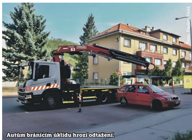
Autům bránícím úklidu hrozí odtažení.