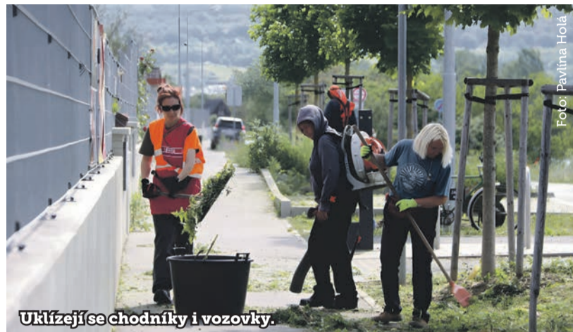
Uklízejí se chodníky i vozovky.

Sídliště (pátevní komunikace a parkoviště před zdravotnickým zařízením), U Starého stadionu vč. parkoviště okolo sportovní haly, Otínská, Jelenovská, Na Výšince, nám. Osvoboditelů (úsek Na Výšince – Karlická)