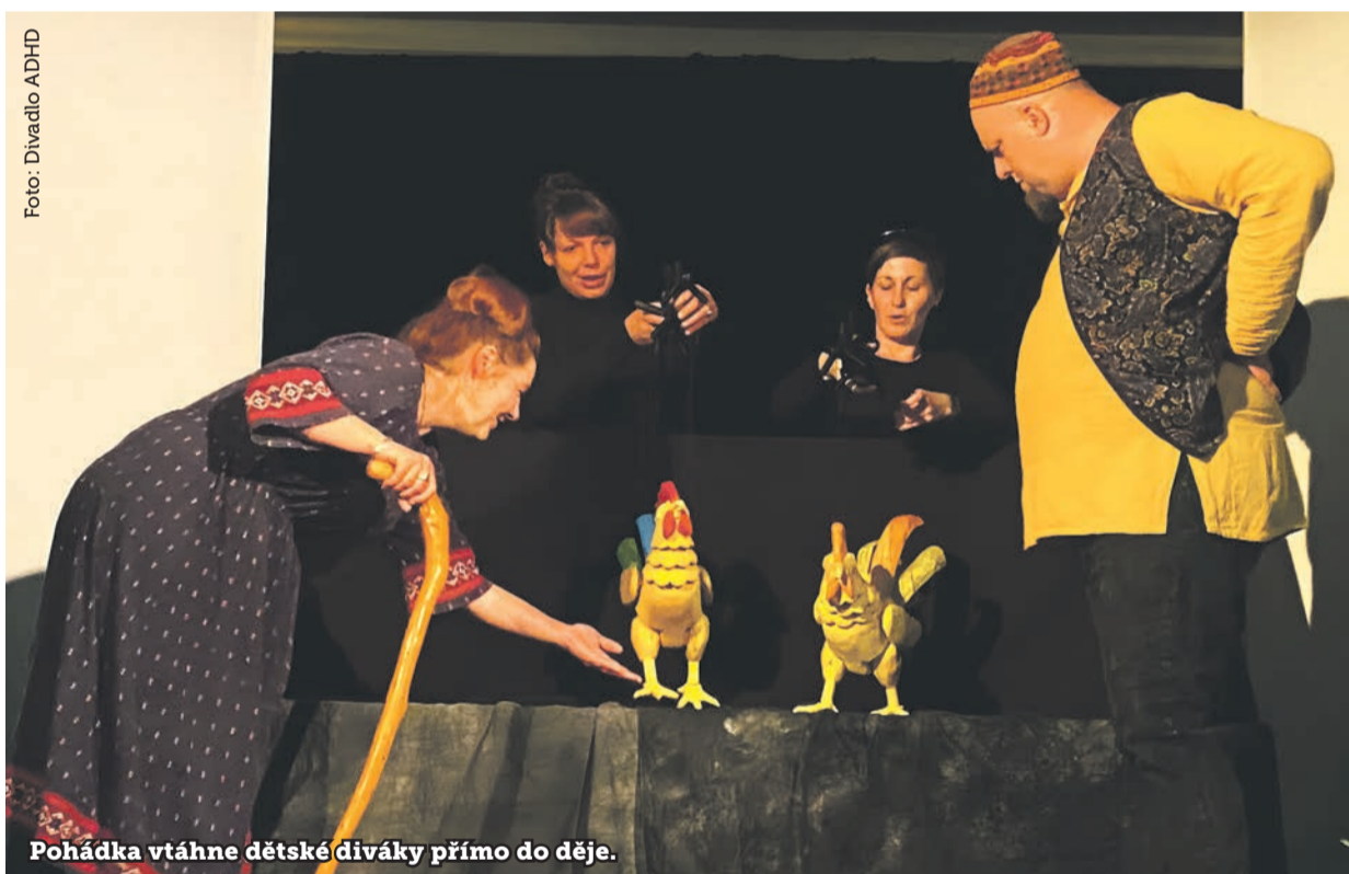
Pohádka vtáhne dětské diváky přímo do děje.