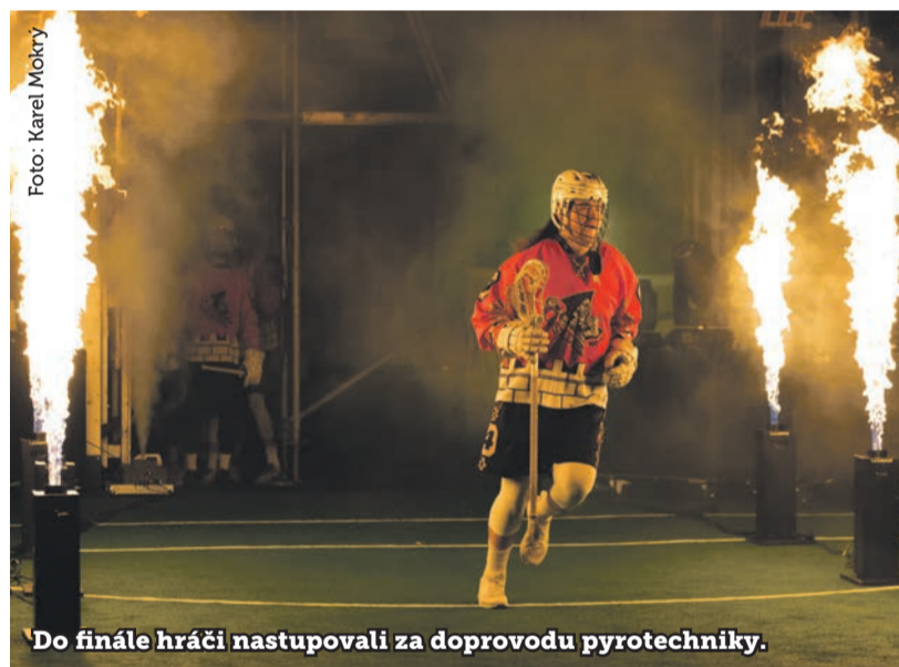
Do finále hráči nastupovali za doprovodu pyrotechniky.