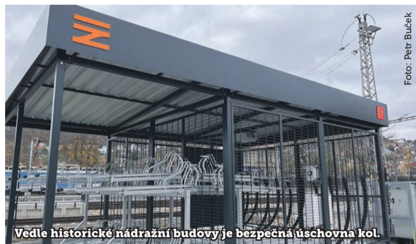
Vedle historické nádražní budovy je bezpečná úschovna kol.