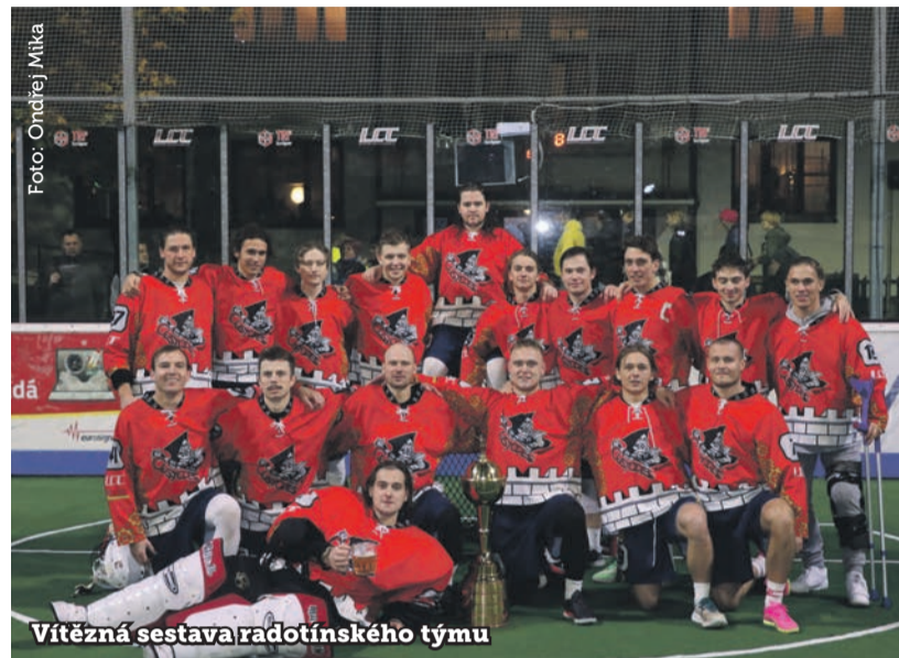
Vítězná sestava radotínského týmu

Radotínští Custodes nenechali v závěrečném Final Four Národní boxlakrosové ligy nikoho na pochybách, kdo je v této lakrosové disciplíně pánem. I přes několik chybějících opor ve finále naprosto přesvědčivě přešli SK Lacrosse Jižní Město 18:8.