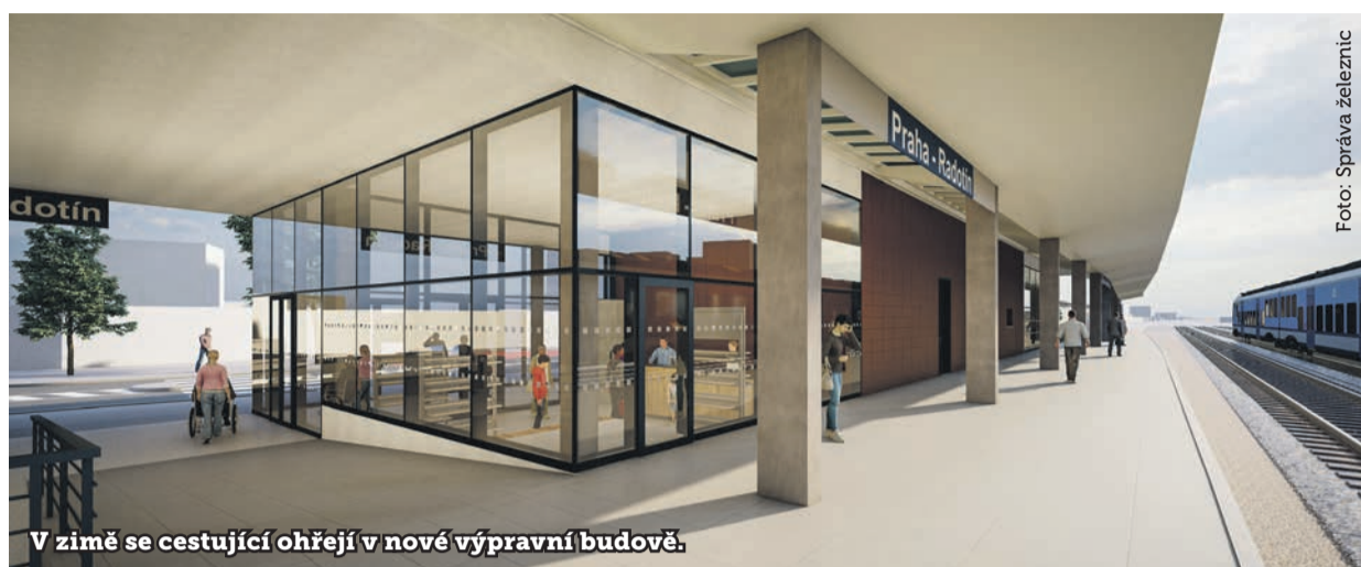
V zimě se cestující ohřejí v nové výpravní budově.

Příští rok se radotínská radnice pustí do rekonstrukce historické nádražní budovy. „Nadále platí, že do ní chceme umístit službu městské policie. Na její opravu máme příslibené prostředky od hlavního města. Poloha nové služebny v centru Radotína bude určitě pro bezpečnost občanů přínosná,“ říká radotínský starosta Karel Hanzlík a dodává: „Aktuálně řešíme majetkové úkony pro bezúplatné nabytí starého nádražního objektu mezi stávajícím