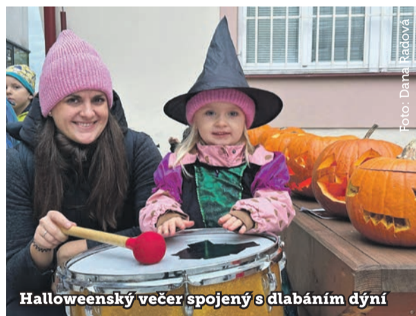
Halloweenské večer spojený s dlabáním dýní