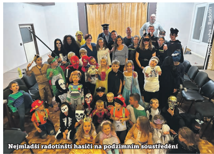
Nejmladší radotínští hasiči na podzimním soustředění