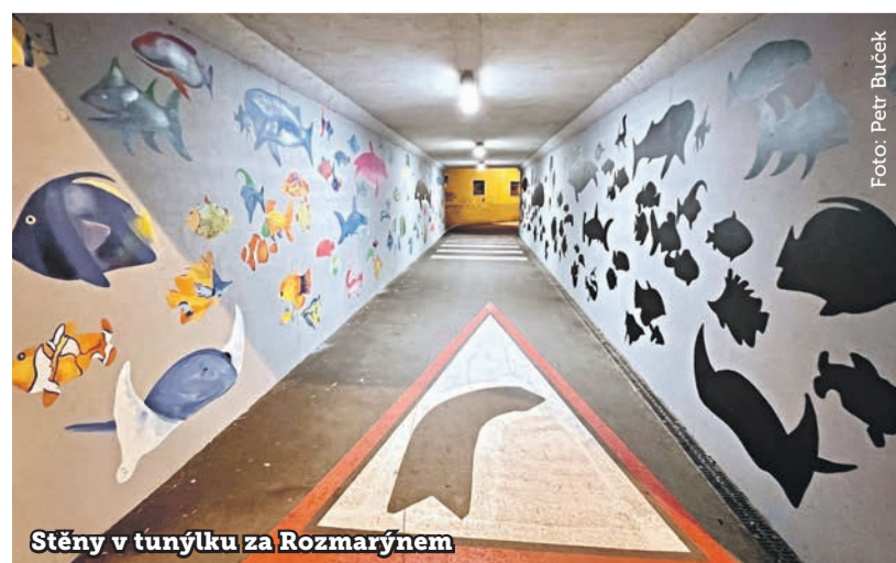
Stěny v tunýlku za Rozmarýnem