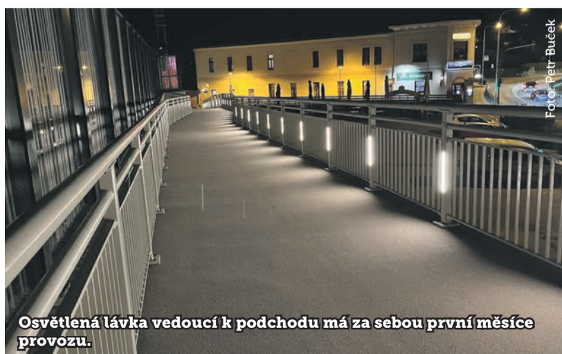
Osvětlená lávka vedoucí k podchodu má za sebou první měsíce provozu.