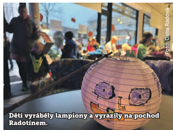
Děti vyráběly lampiony a vyrazily na pochod Radotínem.